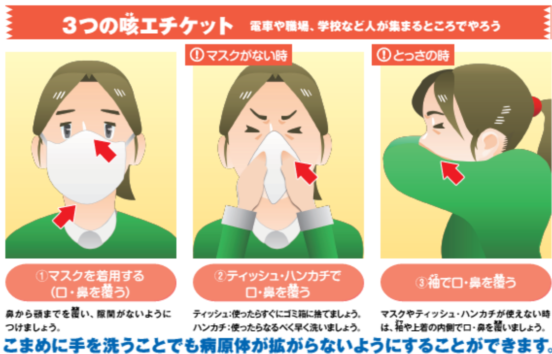
図3 咳エチケットについて