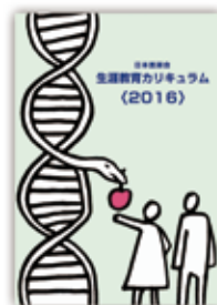
生涯教育カリキュラム(2016)