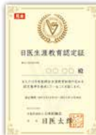
日医生涯教育認定証