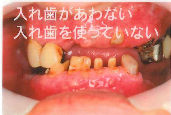
入れ歯があわない 入れ歯を使っていない