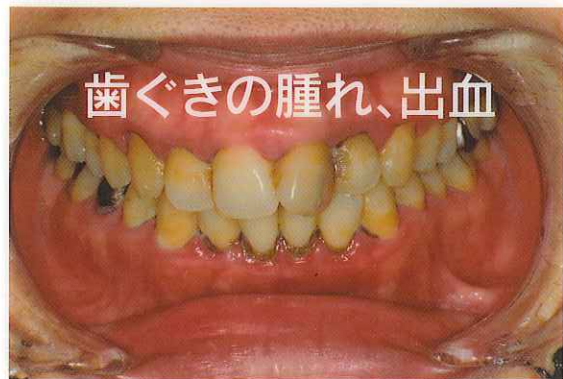
歯ぐきの腫れ、出血