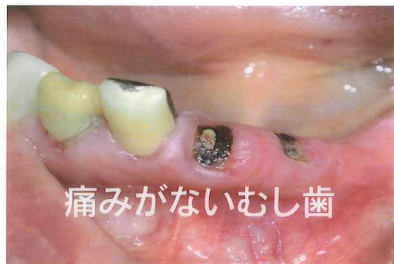
痛みがないむし歯